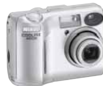
COOLPIX 4600 4,0 miliony efektivních bodů