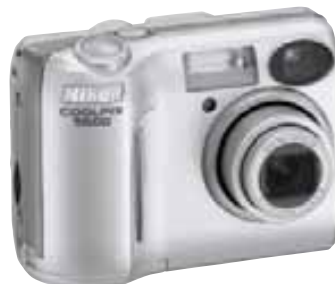
COOLPIX 5600 5,1 milionů efektivních bodů